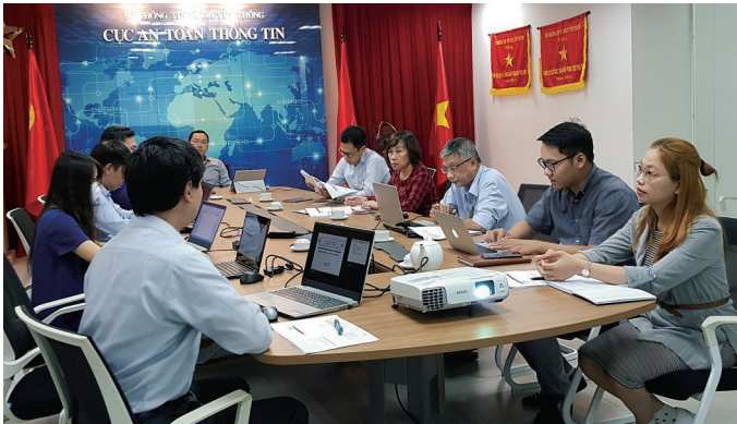
Sesión de estudio con la Asociación de Seguridad de Información de Vietnam.